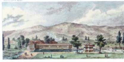
VIEW OF BALKANS IN 1840-1841.