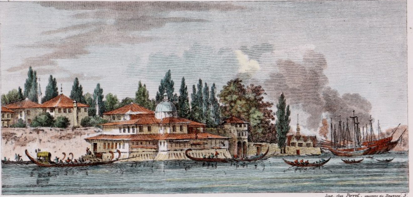
VUE DU PALAIS D'AINALU-KAVAK ET D'UNE PARTIE DE L'ARSENAL .