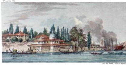
VIEW OF BALKANS IN 1840-1841.