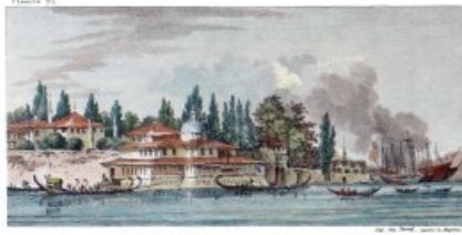
Vue de Balak de Kasab-Makia et Kasab-Dofes de Kasab.