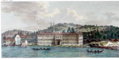
Vue de la Caserte des Constantinien a Oudate de Kasab.