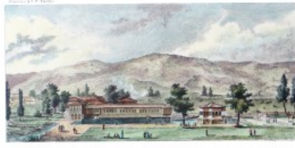
Vue de Balak de Kasab-Makia vers Kasab-Dofes.