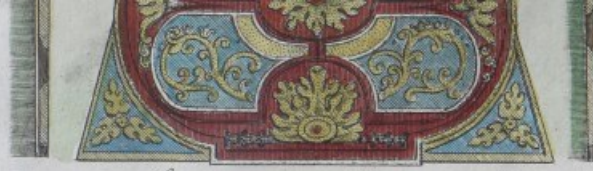
la Tente du grand VIZIR.